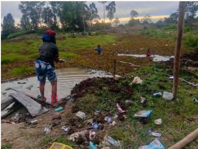
SEORANG LANSIA SEDANG SIBUK MENCUCI PAKAIAN; AIR YANG SAMA DIGUNAKAN ANAK-ANAK UNTUK BERMAIN DAN BERENANG