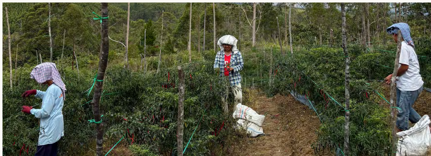
ANGGOTA KOMUNITAS MASYARAKAT ADAT SEDANG PANEN CABAI

Strategi itu membuahkan hasil. Setelah lebih dari dua dekade berjuang, masyarakat berhasil menguasai kembali sekitar 148 hektare dari total wilayah adat yang mereka perjuangkan.