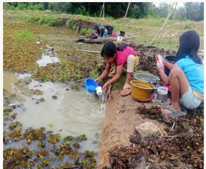
ANAK-ANAK DAN LANSIA TERLIHAT SEDANG MENCUCI PIRING DAN PAKAIAN DARI AIR YANG KERUH

Dengan kata lain, yang terjadi bukan hanya perampasan ruang hidup, tetapi juga pemindahan beban krisis kepada kelas-kelas sosial paling lemah. Sejarah Indorayon telah menunjukkan bahwa pencabutan izin tanpa pemulihan hanyalah perpindahan beban dari perusahaan kepada rakyat. Jika negara sungguh ingin berpihak pada keselamatan lingkungan dan masyarakat adat, maka eks-konsesi TPL tidak boleh dibiarkan menjadi Samosir yang kedua. Sebab kemenangan sejati bukan ketika perusahaan berhenti beroperasi, melainkan ketika hutan dipulihkan, hak masyarakat adat dikembalikan, dan rakyat tidak lagi mewarisi derita dari kerusakan yang mereka tidak pernah ciptakan.