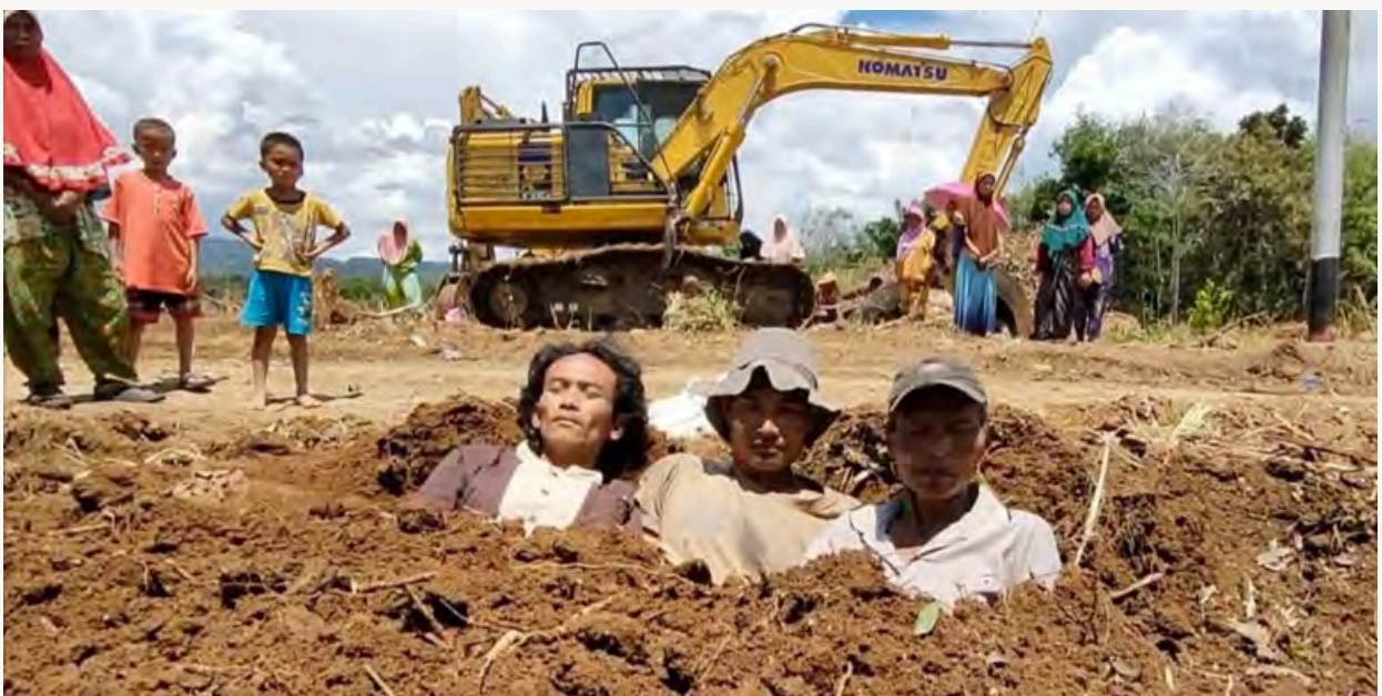
SEJUMLAH WARGA DESA SANGGAPATI TAPSEL LAKUKAN AKSI TANAM DIRI SEBAGAI BENTUK PROTES PENGUSAKAN KEBUN MASYARAKAT OLEH PT TPL

Dalam konteks inilah reforma agraria menemukan relevansinya. Bukan sekadar soal pembagian tanah, melainkan upaya membangun kembali relasi sosial yang lebih adil di pedesaan. Sebab persoalan utama bukan hanya siapa yang menguasai tanah hari ini, tetapi siapa yang memperoleh manfaat dari tanah tersebut dan siapa yang terus-menerus tersingkir darinya.