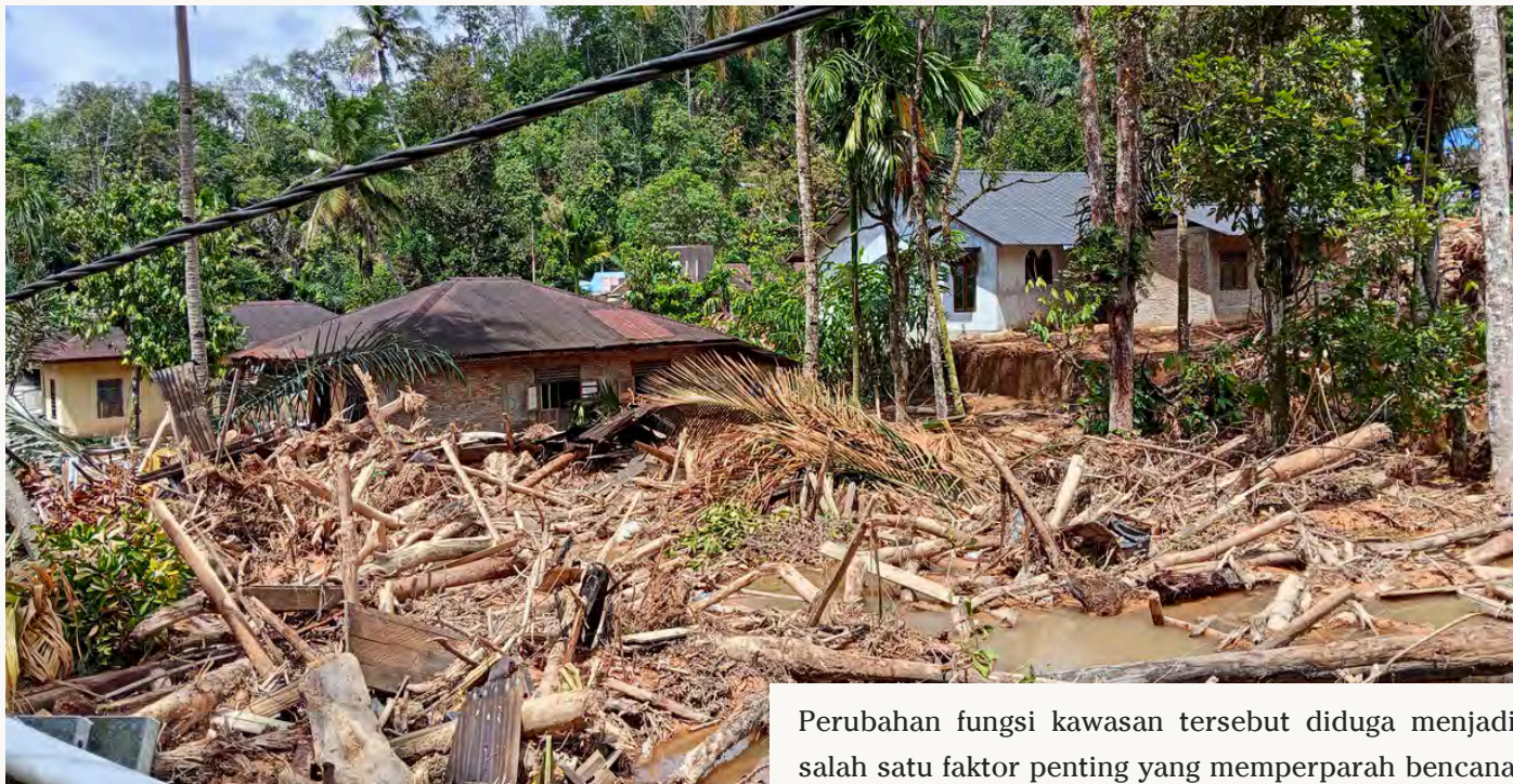
AKIBAT BENCANA EKOLOGIS DI ADIAN KOTING, TAPANULI UTARA

Masih jelas dalam ingatan masyarakat Sumatera Utara bagaimana dahsyatnya bencana ekologis yang melanda wilayah Tapanuli Utara, Humbang Hasundutan, Tapanuli Tengah, Tapanuli Selatan Kota Sibolga dan sekitarnya pada akhir tahun 2025. Gelondongan kayu, lumpur, dan bebatuan menghantam permukiman warga, terbawa deras arus Sungai yang meluap. Peristiwa tersebut bukan sekadar bencana biasa, melainkan peringatan keras tentang rusaknya keseimbangan ekologis yang selama ini menopang kehidupan masyarakat.