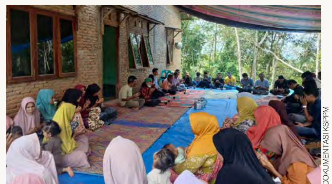
KONSOLIDASI MASYARAKAT BATANG TURA JULU PASCA TUTUP TPL

Kalimat itu muncul ketika masyarakat membicarakan masa depan tanah mereka setelah pencabutan izin TPL. Menariknya, ruang seperti wiritan tidak hanya berfungsi sebagai kegiatan keagamaan, tetapi juga menjadi ruang sosial tempat warga berdiskusi mengenai persoalan kampung, kehidupan sehari-hari, dan masa depan generasi mereka.