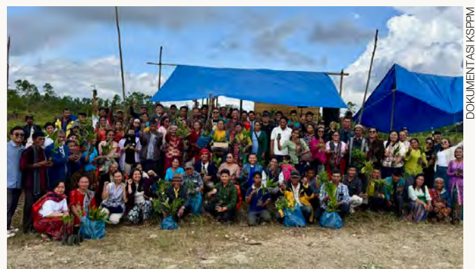
Masyarakat Adat Natinggir dan Natumingka merayakan Hari Peringatan Lingkungan Hidup

Ketika sejumlah jalan utama mendapatkan perhatian dan perbaikan, akses menuju kampung-kampung Masyarakat Adat justru kerap terabaikan. Jalan menuju Huta Natinggir, misalnya, masih dipenuhi bebatuan besar dan tajam yang menyulitkan mobilitas warga. Kondisi ini menunjukkan bahwa pembangunan yang dilakukan tidak selalu menjangkau masyarakat yang hidup berdampingan langsung dengan wilayah konsesi perusahaan.