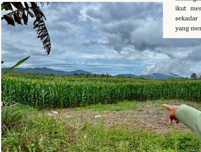
Ladang jagung masyarakat Natinggir yang dulunya adalah lahan eukaliptus milik TPL

Konflik yang berkepanjangan itu tidak hanya menyebabkan hilangnya akses masyarakat terhadap tanah, tetapi juga memunculkan berbagai bentuk kekerasan. Masyarakat mengalami intimidasi, kekerasan fisik, perusakan rumah dan sarana transportasi, hingga tekanan psikologis yang mendalam. Situasi seperti ini menimbulkan pertanyaan mendasar: sejauh mana sebuah perusahaan dapat disebut berkontribusi bagi masyarakat jika pada saat yang sama keberadaannya justru melahirkan konflik dan penderitaan bagi sebagian warga?