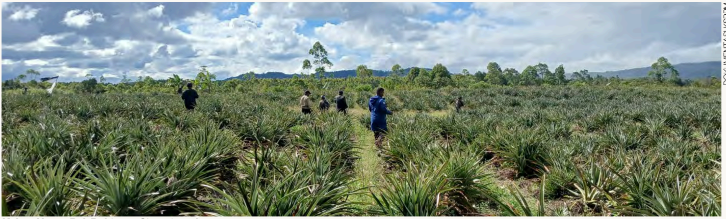
Kebun Nanas Pak Robinson Simanjuntak

dipanen setiap dua minggu sekali. Kombinasi tanaman jangka pendek dan jangka panjang membuat pendapatan keluarga menjadi lebih stabil serta mengurangi risiko usaha tani.