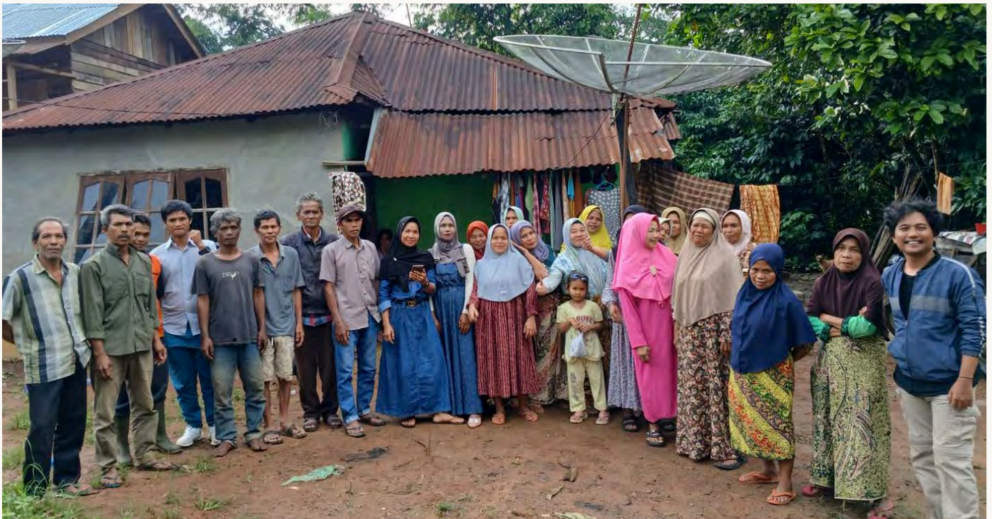
KOMUNITAS MASYARAKAT ANGKOLA DOKUMENTASI KSPPM

Karena itu, ketika masyarakat Batang Tura Julu terus bergerak hari ini, mereka sesungguhnya tidak hanya sedang memperjuangkan hak atas tanah. Mereka sedang merawat sebuah nilai yang telah lama menjadi fondasi kehidupan bersama: keyakinan bahwa perubahan hanya mungkin terjadi ketika masyarakat memiliki hagiot —kemauan untuk peduli, bergerak, dan bertanggung jawab terhadap masa depan bersama.