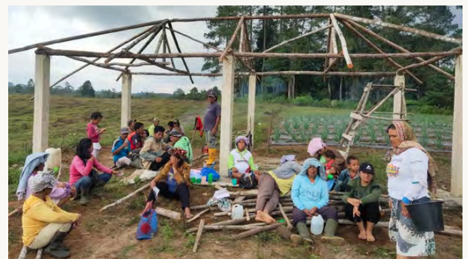
Marsiadapari Kelompok Masyarakat Adat Natinggir

Kesadaran kolektif ini lahir dari pemahaman bahwa kerusakan lingkungan tidak hanya berdampak pada satu orang, tetapi akan memengaruhi seluruh komunitas. Karena itu, menjaga alam dipandang sebagai tanggung jawab bersama yang harus dilakukan secara gotong royong.