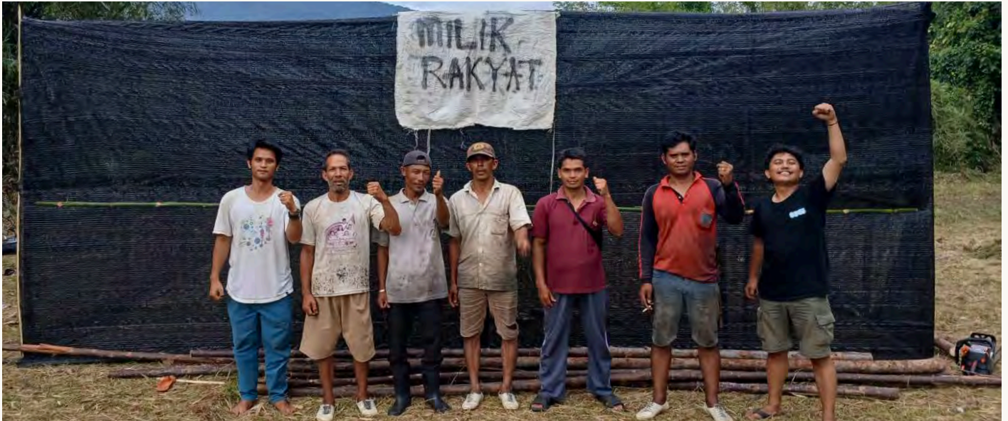
RUMAH PEMBIBITAN PEJUANG AGRARIA MASYARAKAT BATANG TURA JULU

Di Batang Tura Julu, Kecamatan Sipirok, terdapat banyak hal yang tidak tercatat dalam dokumen resmi, tetapi hidup dan diwariskan melalui percakapan sehari-hari masyarakat. Salah satunya adalah kata hagiot . Dalam bahasa Angkola, kata ini sering dimaknai sebagai inisiatif, kemauan untuk bergerak, atau kesediaan mengambil bagian dalam urusan bersama. Namun bagi masyarakat Angkola, hagiot lebih dari sekadar kata; ia merupakan nilai hidup yang menuntun cara mereka memandang diri, komunitas, dan masa depan kampung halaman.