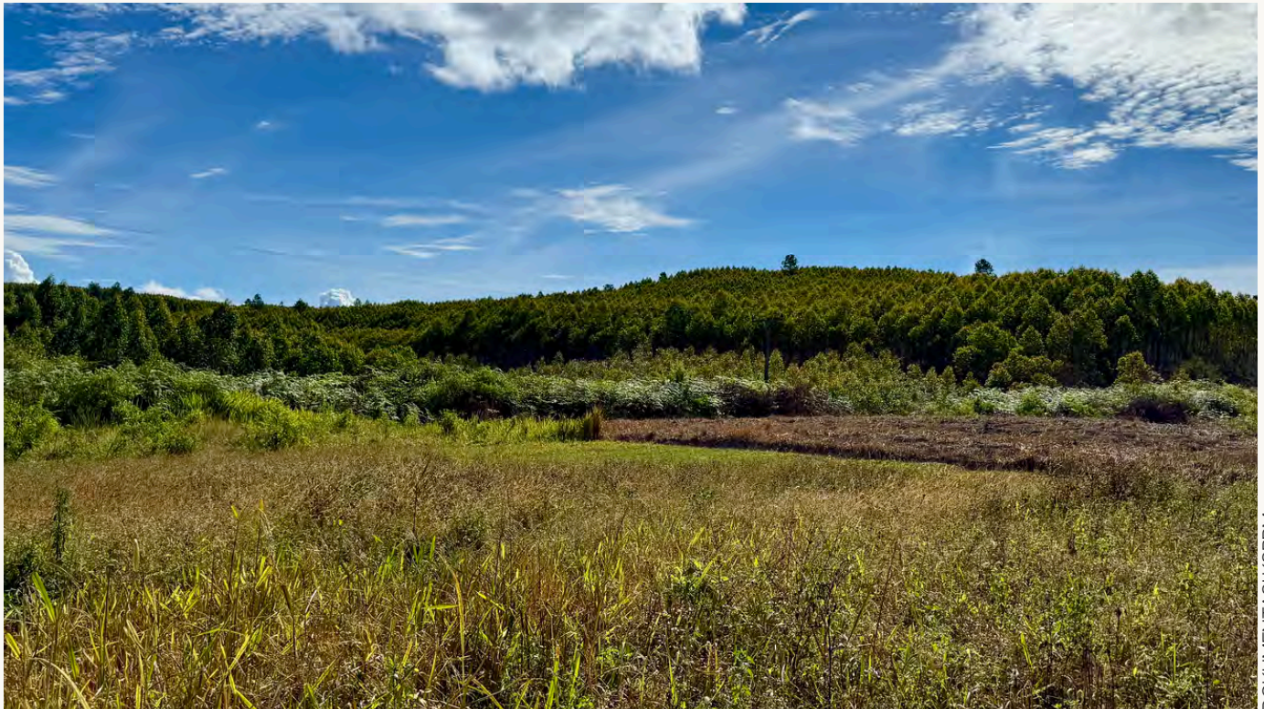
Tanaman tampak kering akibat pohon eukaliptus di Aek Raja

Di sinilah pentingnya kerja-kerja pendampingan masyarakat yang dilakukan berbagai organisasi, termasuk KSPPM. Perjuangan Masyarakat Adat hari ini bukan hanya tentang memperoleh kembali tanah yang selama ini diperebutkan, tetapi juga tentang memulihkan hubungan yang rusak antara manusia dan alam.