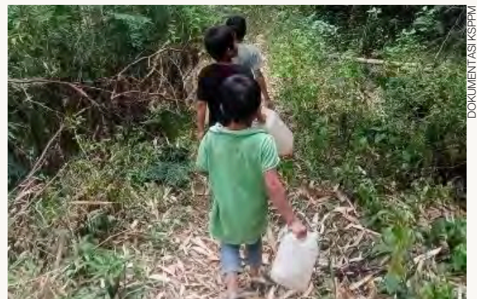
ANAK-ANAK MENEMPUH PERJALANAN 30 MENIT KE DALAM HUTAN UNTUK MENDAPATKAN AIR BERSIH

Tidak saja untuk kebutuhan pengairan pertanian, kebutuhan air untuk konsumsi dan keperluan rumah tangga pun sangat susah, terutama wilayah di dataran tinggi. Persoalan krisis air seakan sudah menjadi agenda tahunan di Pulau Samosir. Warganya pun mau tidak mau harus beradaptasi dengan krisis yang menimpa. Untuk bertahan, mereka biasanya akan membeli air minum dengan harga Rp.100.000 – 150.000 per balteng yang berisi 1000 liter air untuk kebutuhan rumah, yang hanya bertahan sekitar dua minggu. Anak-anak juga harus menyusuri hutan yang jauh dari permukiman untuk mendapatkan air bersih. Lebih jauh, kelompok rentan, seperti perempuan, anak-anak, lansia, dan disabilitas menjadi korban paling terdampak atas krisis air.