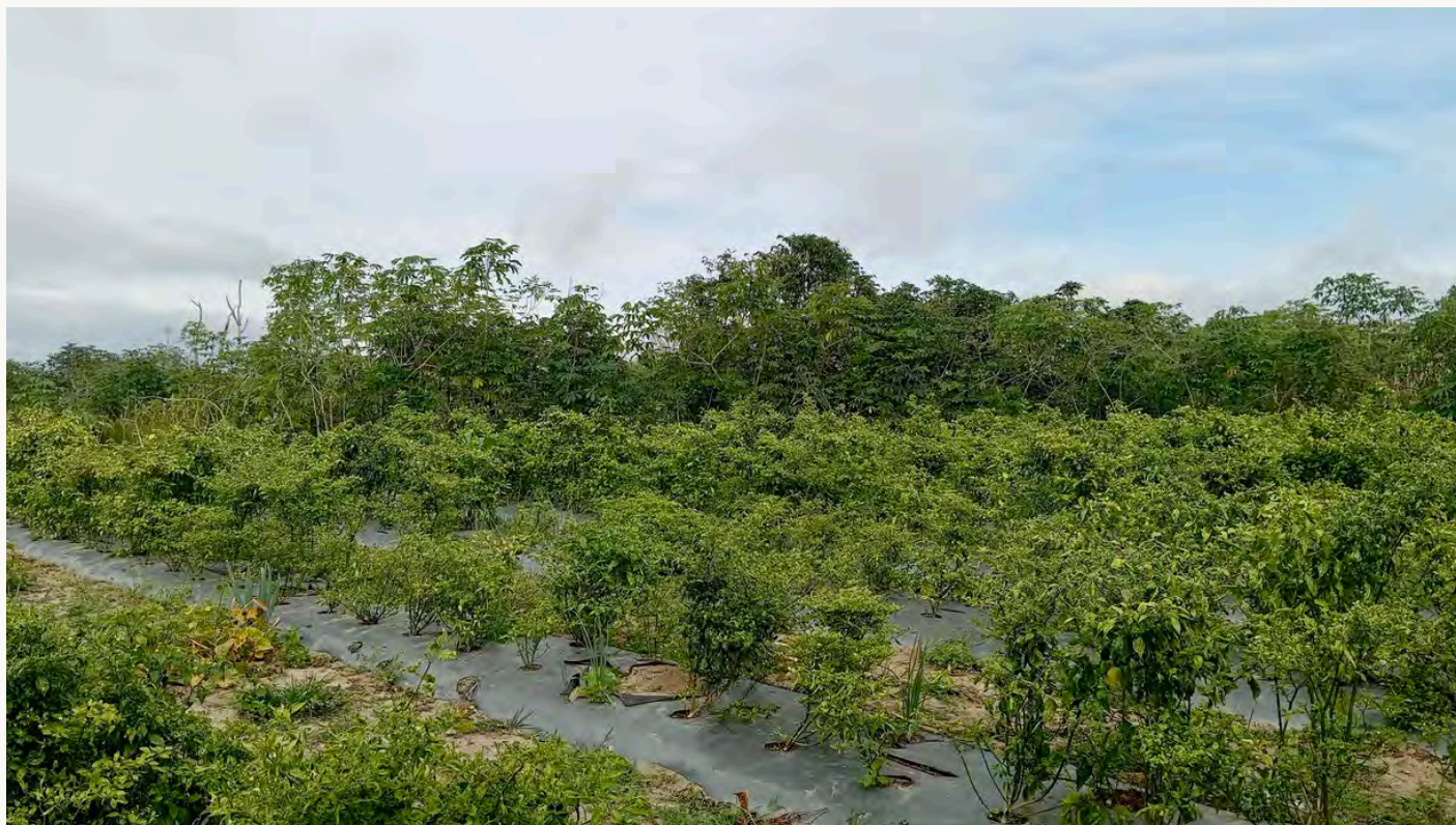
CABAI SEBAGAI KOMODITAS UTAMA UNTUK EKONOMI KELUARGA

Di tengah segala keterbatasan, perempuan menunjukkan bahwa harapan selalu dapat tumbuh dari tanah yang dirawat dengan kesabaran dan keberanian. Karena itu, perjuangan menuju kedaulatan pangan sejatinya adalah perjuangan untuk memulihkan hubungan manusia dengan alam, sekaligus memastikan bahwa tidak ada lagi model pembangunan yang mengorbankan lingkungan dan kehidupan masyarakat.