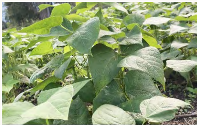
Kacang merah, yang di tanam di wilayah adat Op. Raja Nasomalomarhohos Natinggir DOKUMENTASI KSPPM

Dalam sistem ekonomi yang bertumpu pada satu perusahaan besar, masyarakat perlahan menjadi bergantung pada keberadaan perusahaan tersebut. Ketika perusahaan berkembang, masyarakat ikut bergerak. Namun ketika perusahaan berhenti, masyarakat menjadi kelompok pertama yang merasakan dampaknya. Ketergantungan semacam ini sering kali membuat masyarakat kehilangan kemampuan untuk membangun kemandirian ekonomi yang lebih beragam.