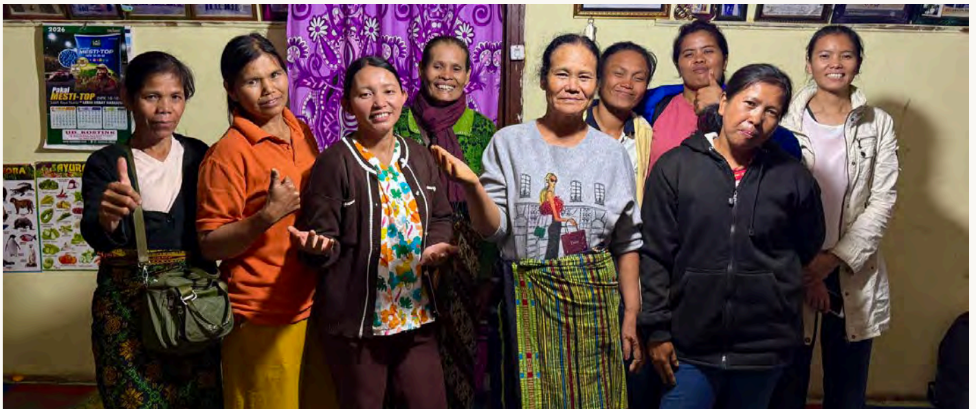
KELOMPOK INA MANADUMA DARI PANDUMAAN-SIPITUHUTA

Perjuangan itu menuntut pengorbanan yang tidak sedikit. Waktu, tenaga, pikiran, bahkan biaya pribadi harus mereka keluarkan. Tidak jarang mereka meninggalkan keluarga selama sehari-hari untuk mengikuti aksi, rapat, dan advokasi hingga ke ibu kota