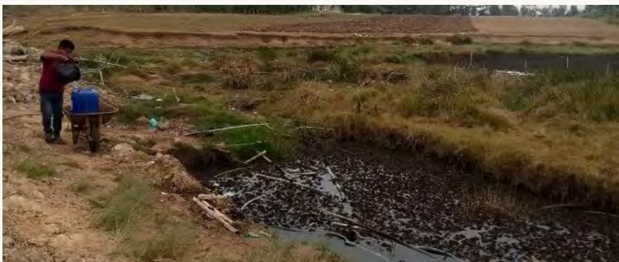
KUBANGAN BEKAS GALIAN ALAT BERAT MENJADI SUMBER AIR DI TENGAH KEKERINGAN BERKEPANJANGAN

Belajar dari Samosir—terutama di pulau—hengkangnya PT IIU sejak 2003, tidak pernah benar-benar diikuti oleh tindakan pemulihan lingkungan, baik oleh pihak perusahaan maupun negara.