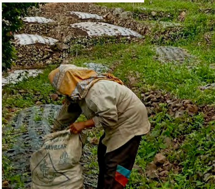
IBU-IBU KT SUBUR TANI MEMANEN BAWANG DI DESA SITIO-TIO DOKUMENTASI KSPPM

Ketika pendapatan keluarga menurun dan kebutuhan hidup makin sulit dipenuhi, perempuan kerap menghadapi beban ganda. Selain mengurus rumah tangga, mereka juga dituntut mencari sumber pendapatan tambahan demi mempertahankan keberlangsungan keluarga. Karena itu, penguatan kapasitas perempuan melalui pendidikan, akses terhadap sumber daya, serta keterlibatan dalam pengambilan keputusan menjadi langkah penting dalam menghadapi krisis iklim sekaligus membangun ketahanan pangan yang berkeadilan.