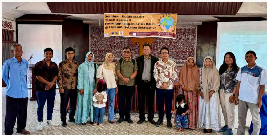
AMANG MENGIKUTI SEMINAR KOLABORATIF DI KANTOR PUSAT GKPA

Baginya, perjuangan ini sangat personal. Lahan seluas 2,3 hektare yang dimilikinya di Payah Sisubut turut terdampak aktivitas perusahaan. Pohon karet, kemiri, dan petai yang menjadi sumber penghidupan keluarganya hilang. Lebih dari itu, dia menyaksikan penderitaan warga lain yang kehilangan tanah, sumber pendapatan, dan rasa aman. Karena itulah dia memilih terus bersuara.