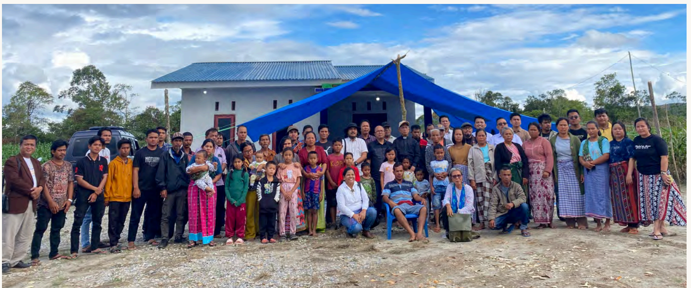
KUNJUNGAN PASTORAL KE KOMUNITAS MASYARAKAT ADAT NATINGGIR PASCA PERISTIWA PENYERANGAN DARI PT TPL DOKUMENTASI KSPPM

Perjuangan itu menuntut pengorbanan yang tidak sedikit. Waktu, tenaga, pikiran, bahkan biaya pribadi harus mereka keluarkan. Tidak jarang mereka meninggalkan keluarga selama berhari-hari untuk mengikuti aksi, rapat, dan advokasi hingga ke ibu kota negara. Semua dilakukan dengan satu tujuan: