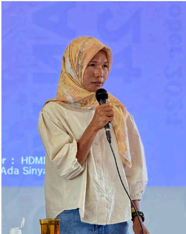
SINAR JUWITA POHON MENCERITAKAN PERJUANGAN AMANG

aksi tanam diri merupakan simbol bahwa hukum dan keadilan telah gagal melindungi mereka.