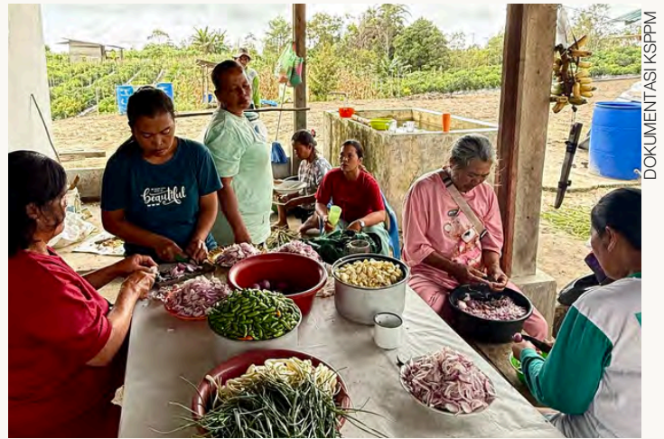
PEREMPUAN NATINGGIR MEMPERSIAPKAN ACARA MAKAN BERSAMA

Jika menengok ke belakang, keberadaan PT Toba Pulp Lestari (PT TPL) turut memperparah kerentanan masyarakat. Alih fungsi lahan menjadi kawasan hutan tanaman industri telah mempersempit ruang kelola masyarakat, termasuk perempuan, terhadap sumber-sumber pangan lokal. Berkurangnya akses terhadap lahan pertanian, sumber air, dan hasil hutan berdampak langsung pada kemampuan keluarga untuk memenuhi kebutuhan pangannya secara mandiri.