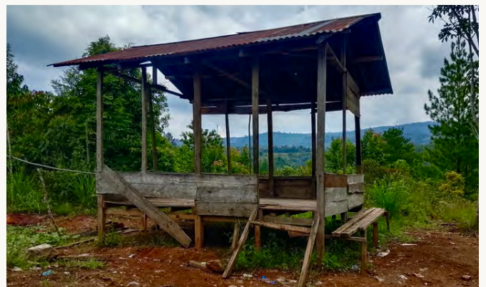
POSKO PERJUANGAN DI DUSUN PAYAH SISUBUT

Perempuan-perempuan yang tergabung dalam MACAN secara bergiliran menjaga posko setiap hari untuk memastikan perusahaan tidak kembali beroperasi di wilayah mereka. Namun perjuangan itu tidak berjalan mudah. Pada tahun 2025, posko tersebut dibakar oleh pihak yang diduga berkaitan dengan kepentingan perusahaan. Peristiwa itu tidak membuat masyarakat mundur. Mereka kembali membangun posko secara gotong royong dan melanjutkan perjuangan.