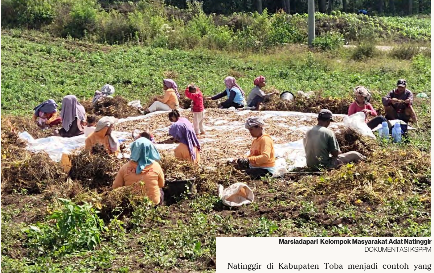
Marsiadapari Kelompok Masyarakat Adat Natinggir DOKUMENTASI KSPPM

Di berbagai wilayah Tapanuli, perubahan sosial dan ekonomi pasca berakhirnya aktivitas PT Toba Pulp Lestari (TPL), membawa dampak yang beragam bagi masyarakat. Di sebagian tempat, masyarakat mulai menata ulang sumber penghidupan setelah lama berada dalam sistem ekonomi yang bertumpu pada perusahaan besar.