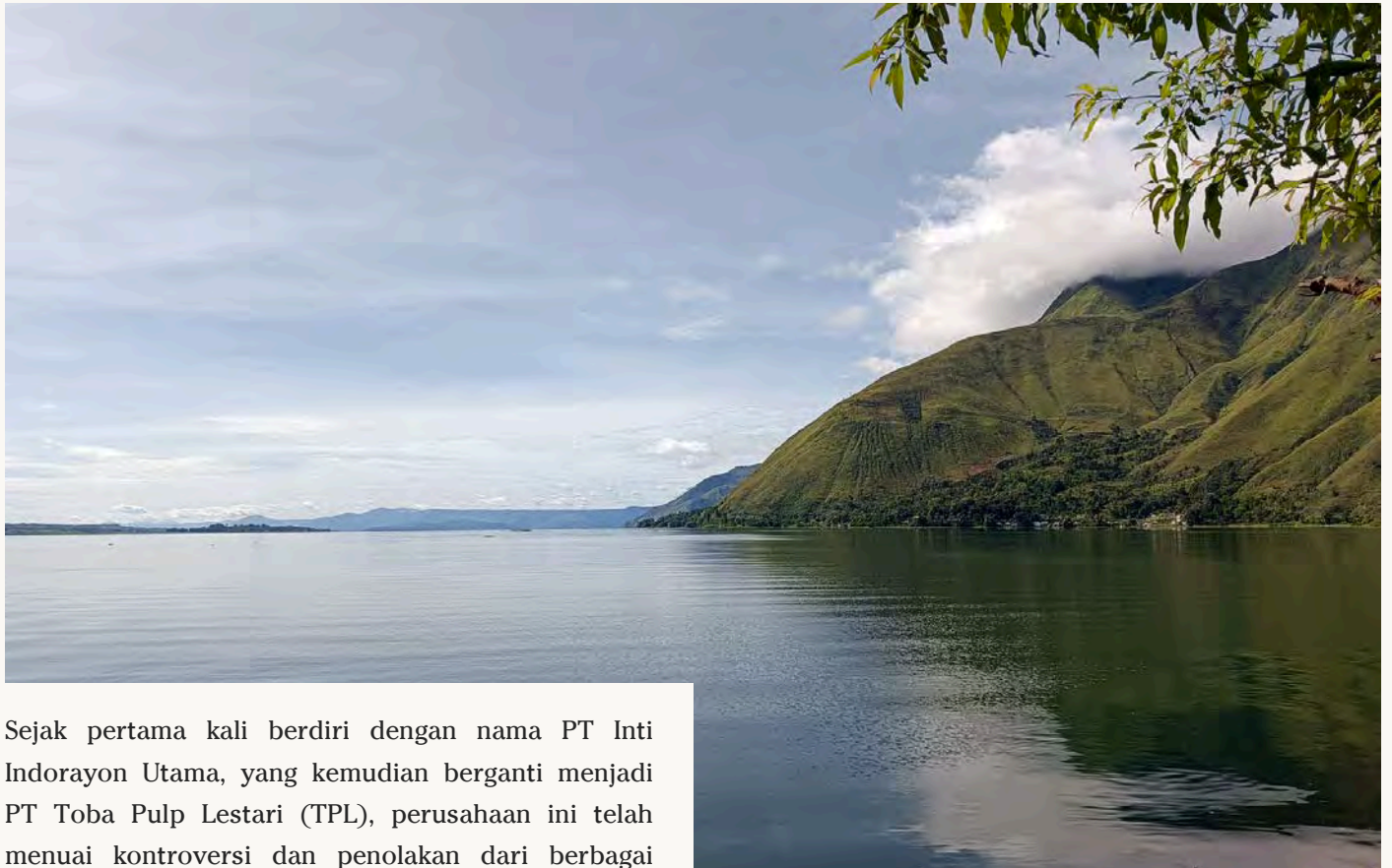
Pemandangan Perjalanan ke Desa Buntu Mauli DOKUMENTASI KSPPM

Sejak pertama kali berdiri dengan nama PT Inti Indorayon Utama, yang kemudian berganti menjadi PT Toba Pulp Lestari (TPL), perusahaan ini telah menuai kontroversi dan penolakan dari berbagai kalangan masyarakat. Penolakan tersebut bukanlah bentuk penolakan tanpa alasan, melainkan lahir dari pengalaman panjang masyarakat yang merasakan langsung dampak sosial dan ekologis dari keberadaan perusahaan.