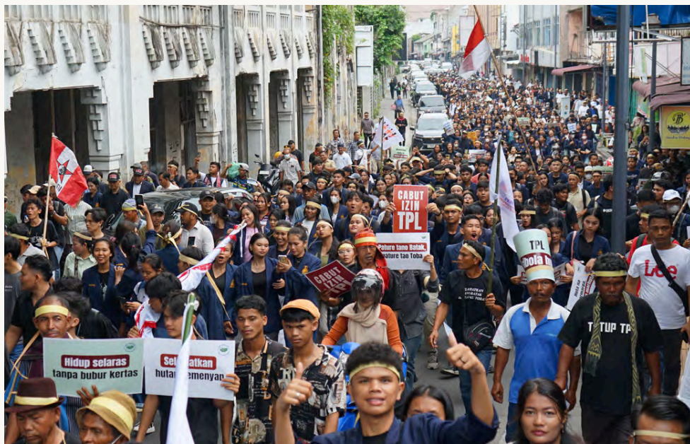
DEMONSTRASI DI DEPAN KANTOR GUBERNUR SUMUT DOKUMENTASI KSPPM

Jauh sebelum bencana ekologis terjadi, masyarakat adat, petani, organisasi masyarakat sipil, dan gereja-gereja di kawasan Danau Toba telah menyuarakan berbagai kritik terhadap operasional PT Toba Pulp Lestari (TPL). Sepanjang tahun 2025, konsolidasi gerakan rakyat makin masif dilakukan dengan tuntutan utama: menutup operasional PT TPL dan memulihkan ruang hidup masyarakat.